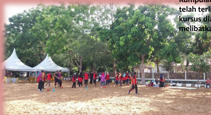
Antara aktiviti yang dijalankan semasa di pantai Pengkalan Balak.

Unit Pentadbiran KMM telah menganjurkan Kursus Berpasukan Kumpulan Pelaksana pada 11 – 13 Mei 2016. Seramai 85 staf sokongan telah terlibat dengan kursus tiga hari berkenaan. Pada hari pertama, kursus diadakan di pantai Pengkalan Balak yang mana ianya banyak melibatkan aktiviti sukaneka dan santai.