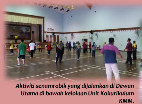
Aktiviti senamrobik yang dijalankan di Dewan Utama di bawah kelolaan Unit Kokurikulum KMM.