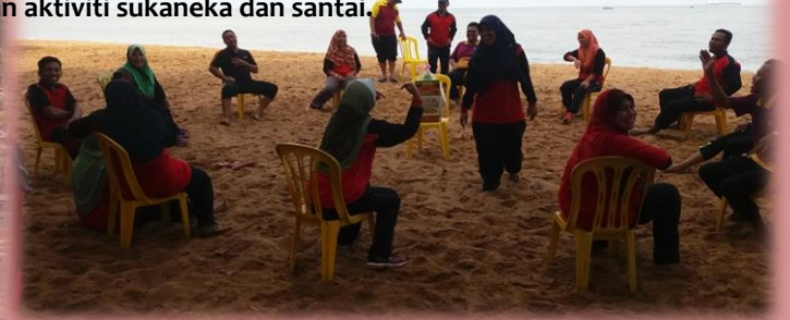
Gelagat peserta dalam aktiviti berebut kerusi yang diselenggarakan oleh Unit Pentadbiran KMM.