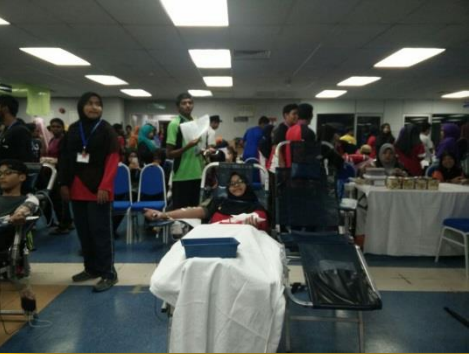
Antara pelajar yang menderma darah kelihatan pada malam tersebut.

Unit Kemahiran Dinamika KMM dengan kerjasama Hospital Melaka telah menganjurkan Program Derma Darah pada 24 Jun 2016 bertempat di aras bawah Perpustakaan. Program tahunan kali ini diadakan pada bulan Ramadhan dan ianya bermula dari jam 8.00 malam sehingga jam 12.00 tengah malam. Pihak hospital menetapkan sasaran sebanyak 250 beg darah dapat dikumpulkan dalam program ini. Tuan Pengarah, Hj Kamarudin bin Mansur juga turut meluangkan masa melihat dan beramah mesra dengan para pelajar yang terlibat sebagai penderma darah pada malam tersebut. Pengerusi program ini iaitu En. Alimi Mat Said dan penyelarasnya, En. Mustafa Kamil bin Sulaiman serta AJK program yang terdiri daripada pensyarah dan pelajar Unit Kemahiran Dinamika telah berjaya melaksanakan program tersebut sehingga jam 1.00 pagi!