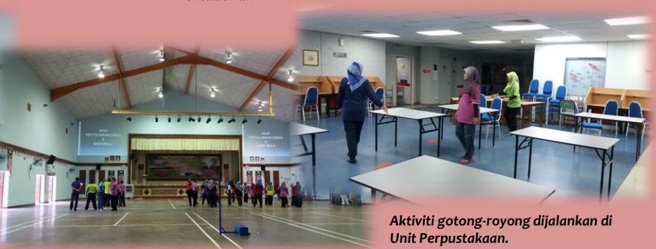
Aktiviti gotong-royong dijalankan di Unit Perpustakaan.