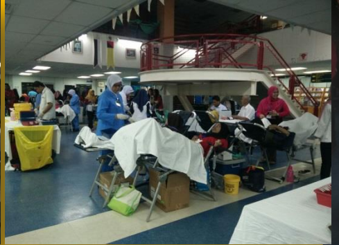
Sebanyak 26 katil disediakan oleh pihak hospital bagi memastikan sasaran 250 beg darah tercapai.