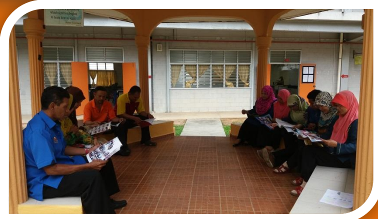
Antara staf sokongan yang terlibat dalam menjayakan Program Jom Baca Bersama untuk 10 minit yang diadakan di wakaf berhampiran Makmal Sains.