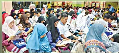
Antara peserta yang terlibat dalam Program Jom Baca Bersama untuk 10 minit yang diadakan di Perbadanan Perpustakaan Awam Melaka.