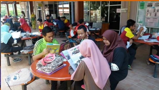
Antara pelajar yang terlibat dalam Program Jom Baca Bersama untuk 10 minit yang diadakan di perkarangan bangunan Perpustakaan KMM.