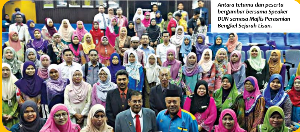
Antara tetamu dan peserta bergambar bersama Speaker DUN semasa Majlis Perasmian Bengkel Sejarah Lisan.