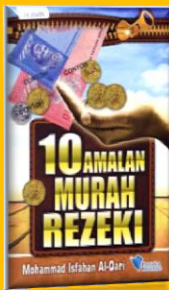
Tajuk : 10 Amalan Murah Rezeki