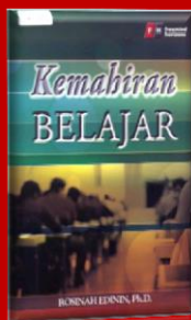
Tajuk : Kemahiran Belajar (Cetakan tahun 2014)

Kementerian Pendidikan Malaysia sentiasa mengambil inisiatif untuk memastikan bahawa Malaysia mempunyai mutu pendidikan yang baik dan terus berusaha secara serius membuat transformasi terhadap semua elemen yang menjurus melahirkan modal insan berkualiti tinggi yang mampu membangun ekonomi berasaskan pengetahuan melangkaui sempadan global. Perancangan dan pelaksanaan Pelan pembangunan Pendidikan Malaysia 2013-2025 adalah tepat dan jelas mengenai hala tuju sistem pendidikan yang rapi dalam melaksanakan pengurusan inovasi dan perubahan pendidikan supaya setara dengan standard antarabangsa. Antara perubahan yang dimaksudkan merangkumi aspek pendekatan pembelajaran murid, kaedah pemilihan guru, latihan guru, penyediaan ganjaran kepada guru dan pemimpin sekolah dan pendekatan pengoperasian Kementerian. Antara cabaran yang dihadapi oleh pendidik ialah integrasi nasional, pendemokrasian pendidikan, tonggak pendidikan UNESCO, globalisasi dalam pendidikan, sokongan keluarga, kepelbagaian budaya, pengaruh perkembangan teknologi maklumat dan komunikasi (ICT) dan juga gejala sosial.