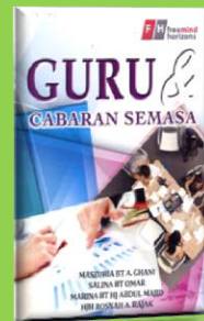
Tajuk : Guru & Cabaran Semasa (Cetakan tahun 2014)

Strok atau lebih dikenali sebagai angin ahmar oleh sebahagian masyarakat kita merupakan satu kumpulan tanda-tanda fizikal yang terhasil akibat kegagalan fungsi otak. Buku ini memperkatakan permasalahan strok, proses kejadian strok dan penjagaan pesakit strok di rumah seperti kaedah melakukan fisioterapi serta menyediakan dan memberikan makanan kepada pesakit strok. Turut dibincangkan kaedah senaman rehabilitasi dan keseimbangan badan serta bagaimana membantu pesakit dalam memperbaiki keupayaan sendiri bagi meningkatkan kualiti hidup pesakit dan juga penjaga. Ditekankan juga kaedah mudah bagi pesakit untuk melaksanakan tuntutan agama seperti solat, berpuasa dan juga ketika bermusafir. Kesedaran dan penjagaan awal berkaitan penjagaan kesihatan diri amat penting untuk semua lapisan masyarakat bagi mengelakkan risiko daripada terjadinya strok.