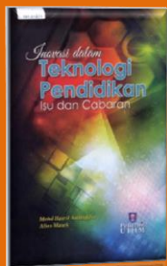
Tajuk : Inovasi dalam Teknologi Pendidikan: Isu dan Cabaran (Cetakan tahun 2014)

Kemahiran belajar amat penting kepada setiap individu kerana ia proses untuk mendapatkan ilmu pengetahuan dan kemahiran supaya individu ini berilmu dan berkemahiran. Kemahiran belajar dalam abad ke-21 merangkumi pemikiran kritis, pemikiran kreatif, kemahiran berkomunikasi dan kemahiran berkolaborasi. Semua kemahiran ini membantu pelajar dalam pembelajaran sepanjang hayat. Strategi pembelajaran adalah kaedah dan teknik yang digunakan oleh guru membantu pelajar untuk meningkatkan kefahaman dan mencapai objektif pengajaran dan pembelajaran. Di antara jenis-jenis pembelajaran yang diperkenalkan oleh Pusat Perkembangan Kurikulum ialah pembelajaran berpusatkan pelajar, pembelajaran bersifat individu, pembelajaran berfikrah, pembelajaran berasaskan teknologi, pembelajaran berasaskan otak dan pembelajaran berasaskan projek.