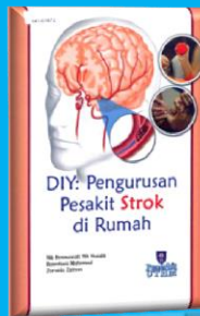
Tajuk : DIY: Pengurusan Pesakit Strok di Rumah

Rezeki mempunyai pengertian yang luas dalam Islam. Tidak hanya tertumpu dalam bentuk wang dan harta. Ia mencakupi segala elemen material mahupun spiritual. Segala bentuk nikmat yang kita perolehi samada atas usaha sendiri mahupun diperolehi daripada sumber pemberian yang lain, semuanya adalah rezeki yang Allah s.w.t. berikan. Hanya jalan dan cabang perolehannya sahaja yang berbeza. Dalam memperolehi segala nikmat rezeki yang diinginkan, yang diidamkan, manusia ataupun hamba secara khususnya tidak hanya boleh berdiam dan hanya menunggu rezeki itu datang dengan alasan setiap manusia itu rezekinya sudah ditentukan. Pastinya kita harus berusaha sedaya upaya dengan kudrat Allah s.w.t. kurniakan bagi mendapatkan setiap rezeki yang dijanjikan itu. Selain berusaha, buku ini juga menghimpunkan amalan-amalan yang wajar dilakukan sebagai hamba-Nya bagi mengundang kemurahan rezeki daripada Allah yang Maha Kaya lagi Maha Pemurah.